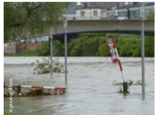
KfV-Umfrage anlässlich des Hochwassers verdeutlicht Handlungsbedarf

Die jüngste Erhebung des KfV zeigt: 57 % der Befragten geben an, sich unzureichend über Schutz- und Vorsorgemaßnahmen informiert zu fühlen. Eine Mehrheit von 53 % ist der Ansicht, dass in Österreich mehr für die Prävention getan werden muss, weitere 40 % stimmen dem zumindest teilweise zu. Besonders auffällig ist die hohe Unterstützung