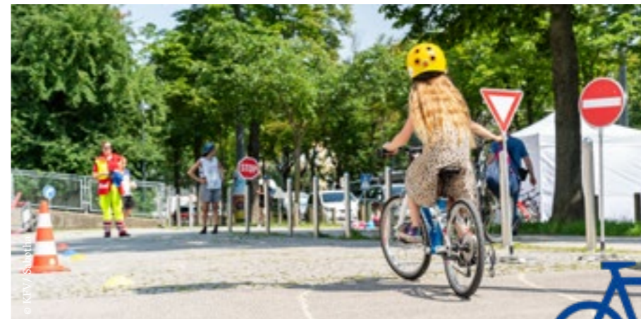
Radfahrende Kinder zwischen 6 und 14 Jahren sind im Straßenverkehr besonders gefährdet.