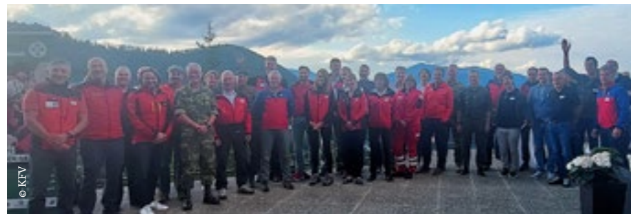
Netzwerksymposium „BergRETTUNG“ mit KFV, Höhlenrettung, Flugrettung, Feuerwehr, Alpenverein, Alpinpolizei, ÖKAS, dem Österreichischen Bundesheer uvm.

Bereits zum zweiten Mal trafen sich Expert*innen des KFV, der Alpinpolizei, Höhlenrettung, dem Alpenverein, der Flugrettung und der Feuerwehr zum 2-tägigen Netzwerksymposium am Semmering. Die Vertreter*innen kamen zusammen, um über aktuelle Herausforderungen zu diskutieren und gemeinsam Lösungen für mehr Sicherheit in den Bergen zu erarbeiten.