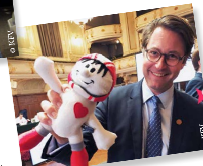
Der deutsche Verkehrsminister Andreas Scheuer mit Stoff-HELMI