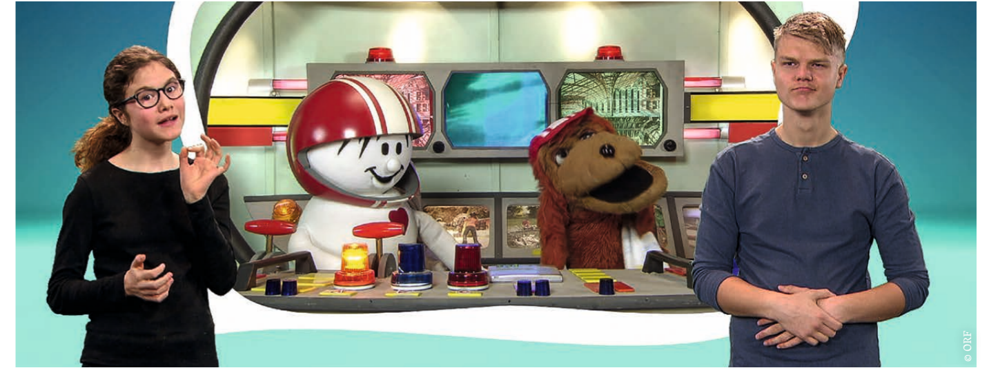
Die beiden Gebärdensprach-Dolmetscher Samira &amp; Ruben im Einsatz für HELMI &amp; Sokrates.