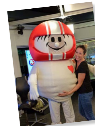
HELMI mit Ö3-Moderatorin Kati Bellowitsch