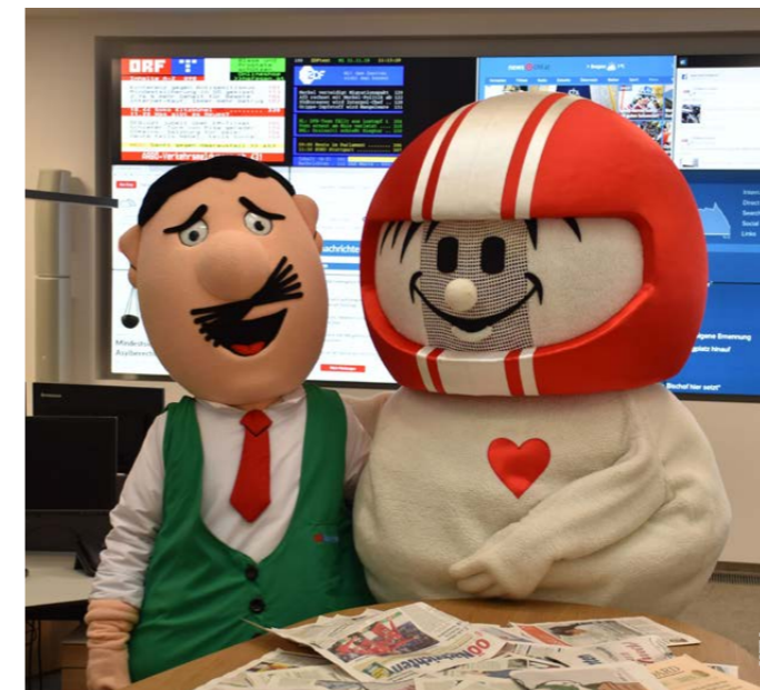
Mostdipf, das beliebte Maskottchen der ÖO Nachrichten, mit HELMI

Über die Jahre hat HELMI im Zuge seines Einsatzes bereits zahlreiche Fans – darunter auch viele prominente Gesichter – kennengelernt und sich gemeinsam mit diesen für die Erhöhung der Sicherheit eingesetzt. ♦